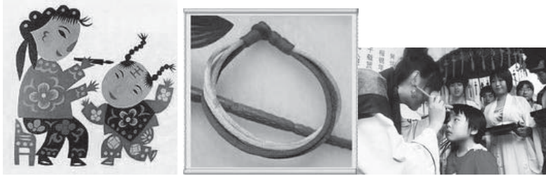
（点“王”图片来源：中国新闻网 2011年06月03日 来源：扬子晚报）

另一个习俗是在儿童头上用雄黄酒画上一个“王”，称为画额，据说可驱避毒虫。最常见的就是用雄黄酒在小儿额头画“王”字，一借雄黄以驱毒，二借猛虎（“王”似虎的额纹，又虎为兽中之王，因以代虎）以镇邪 37 。除在额头、鼻耳涂抹外，亦可涂抹他处，用意一致。山西《河曲县志》云：“端午，饮雄黄酒，用涂小儿额及两手、足心，……谓可却病延年。”